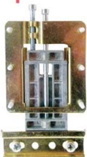
Zawieszka do paneli