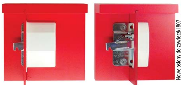
Nowe osłony do zawieszki 807 RV

Na tegorocznych targach SICAM w Pordenone włoski producent akcesoriów meblowych najwyższej jakości – firma Camar kolejny rok z rzędu zaprezentowała dużą liczbę nowych produktów. Świadczy to nie tylko o popularności proponowanych klientom rozwiązań, ale i ciągłym dążeniu działu projektowego Camar do przedstawiania nowych – i nie da się ukryć – w większości rewolucyjnych rozwiązań. Co pokazano w tym roku?