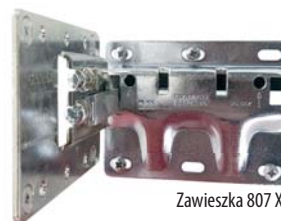
Zawieszka 807 XL

Na tegorocznych targach SICAM w Pordenone włoski producent akcesoriów meblowych najwyższej jakości – firma Camar kolejny rok z rzędu zaprezentowała dużą liczbę nowych produktów. Świadczy to nie tylko o popularności proponowanych klientom rozwiązań, ale i ciągłym dążeniu działu projektowego Camar do przedstawiania nowych – i nie da się ukryć – w większości rewolucyjnych rozwiązań. Co pokazano w tym roku?