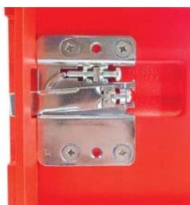
Zawieszka 807 RV

K ilka nowości dotyczy znanej już zawieszki do szafek dolnych typ 807. Największą z nich jest fakt, iż jest to już... rodzina zawieszek do szafek dolnych. Do sprzedaży właśnie dołączyła wersja 807 RV, przeznaczona do montowania w meblach składających się wyłącznie z szuflad. Jak ją opisać najprościej? Jest wklęsła. Element który w standardowej zawieszce jest wypukły, w przypadku tego produktu znajduje się w przygotowanym wcześniej frezie. Dzięki temu nie ma żadnych przeszkód w zamocowaniu prowadnicy, nawet w bezpośrednim sąsiedztwie zawieszki. Same wymiary, regulacja (18 mm w poziomie, 22 mm w pionie) i obciążenie maksymalne pozostają bez zmian.